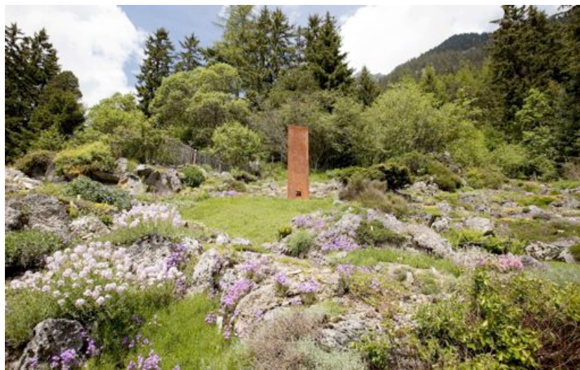
Skulptur : Etienne Krähenbühl, Petit cube suspendu, 2003

2007 erhielt Flore-Alpe den vom Schweizer Heimatschutz verliehenen « Schulthess-Gartenpreis» .