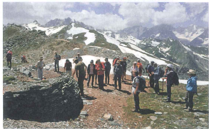
Les participants près du four à chaux