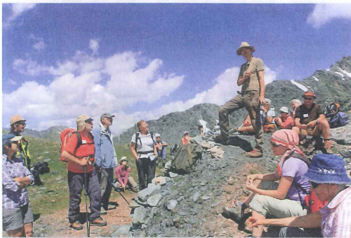
Les participants lors de la première excursion avec le guide Stefan Ansermet