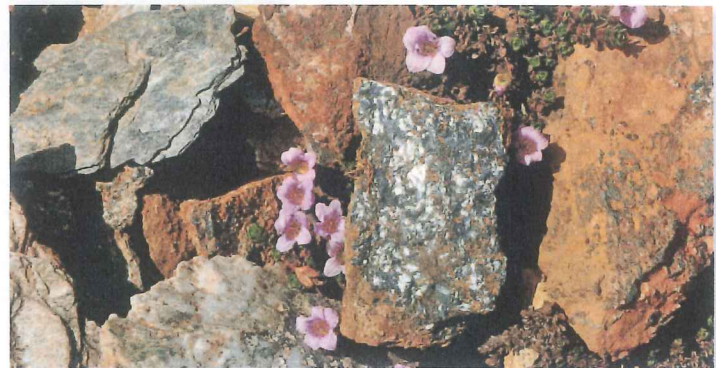
Saxifraga oppositifolia et minerai de fer