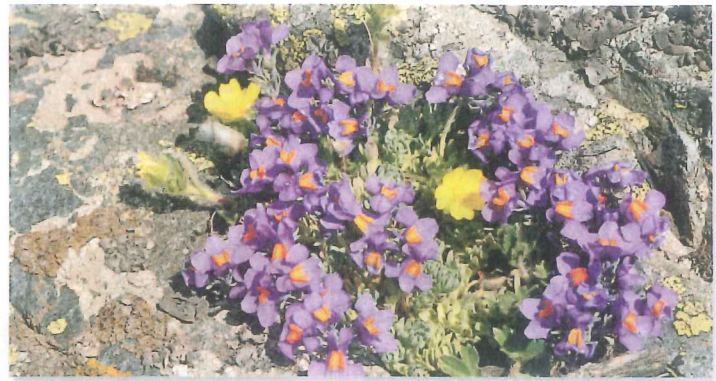
Linaria alpina et Potentilla frigida

Disponible à l'Hospice, au Jardin botanique alpin Flore-Alpe et dans les librairies